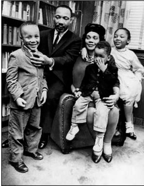
Сликано у Атланти 9. јуна 1965. год.

---- OSTATAK TEKSTA NIJE PRIKAZAN. CEO RAD MOŽETE PREUZETI NA SAJTU WWW.MATURSKI.NET ----