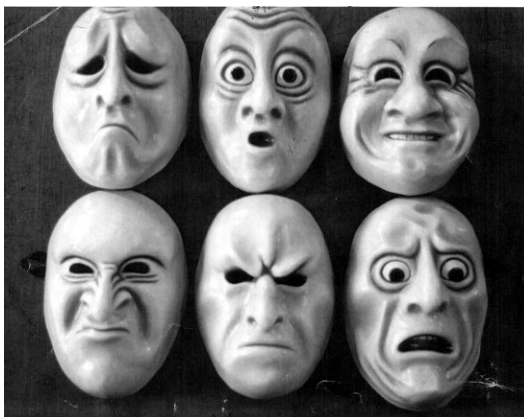
Sl.br.1-Facijalne ekspresije raličitih emocija

Najčešća definicija emocija glasi: " Emocija je reakcija subjekta na stimulus koji je on ocijenio kao važan, a koji višeceralno, motorno, motivaciono i mentalno priprema subjekat za adaptivnu aktivnost. " 1