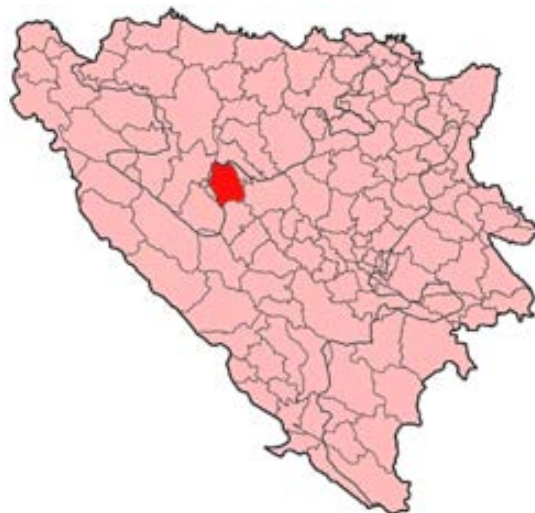
Položaj opštine Jajce na mapi BiH

Već u drugoj polovini 1943. godine većina svih naroda Jugoslavije bila je na strani Narodnooslobodilačkog pokreta. Svetska demokratska javnost sve je više davala podršku oslobodilačkom pokretu jugoslovenskih naroda. Prema "Quadrant" konferenciji u Kvebeku 24. 8. 1943. anglo - američki saveznički štab rešio je da snabdeva partizane oružjem i opremom i da pomaže akcijama komandosa i bombardovanjem strateških objekata. Uskoro dolazi do sve češćeg kontakta između zapadnih saveznika i Vrhovnog štaba u vezi s ratnim pitanjima, te Vrhovni štab dolazi u mogućnost da zahteva da se vrate ratni i trgovački brodovi koje je Italija zaplenila, da se krene sa isporukama savremenog naoružanja (tenkova, artiljerije, avijacije) itd. Iako su priznavali uspehe NOV i slali joj pomoć, zapadni saveznici nisu hteli promeniti svoju politiku prema izbegličkoj monarhističkoj vladi, oni su je i dalje smatrali legitimnim predstavnikom Jugoslavije.